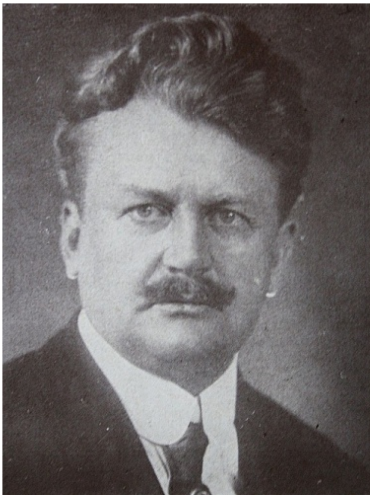
Antonín Benjamin Svojsík (zakladatel českého skautingu)