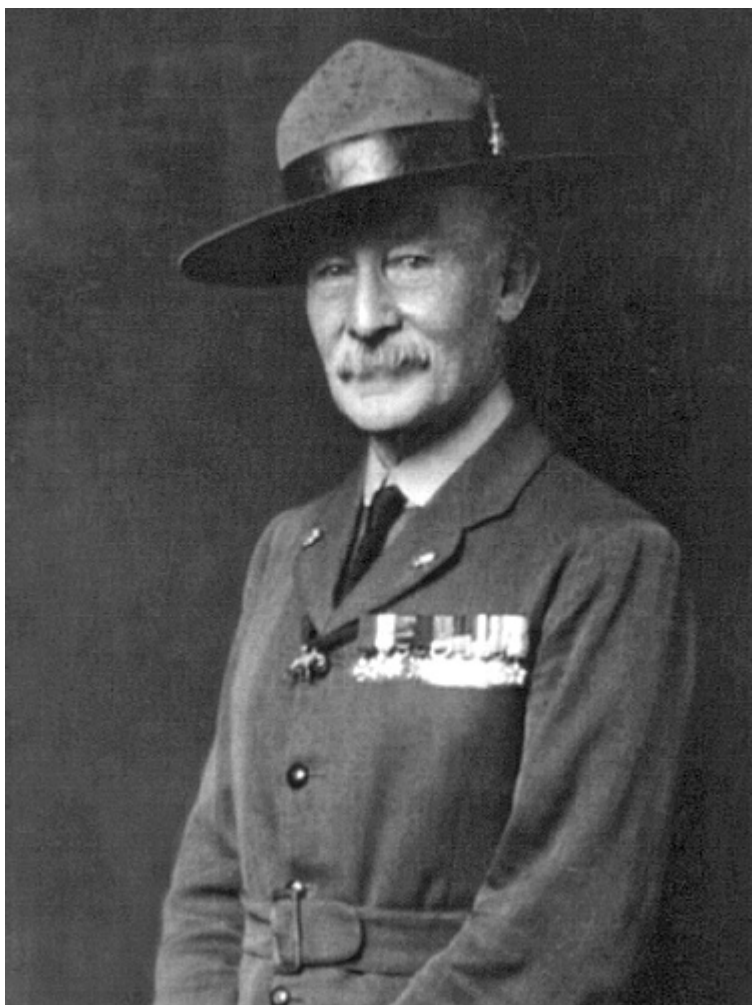
Robert Baden-Powell (zakladatel skautského hnutí)