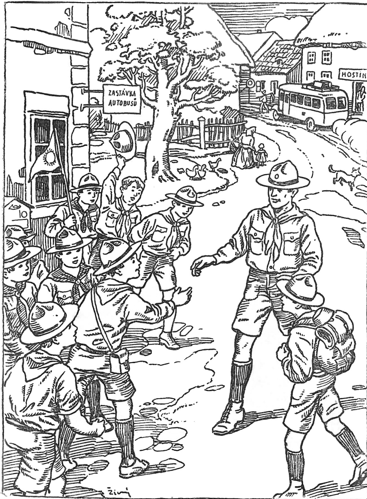
Příjezd Víti Čiperky do Komárova a setkání se smečkou vlčat Ilustrace z knihy (autor: Vincenc Živný)

Hlavní postavou vyprávění je Víťa Čiperka , vlče - nováček z Prahy, který díky tomu, že má ve čtvrté třídě